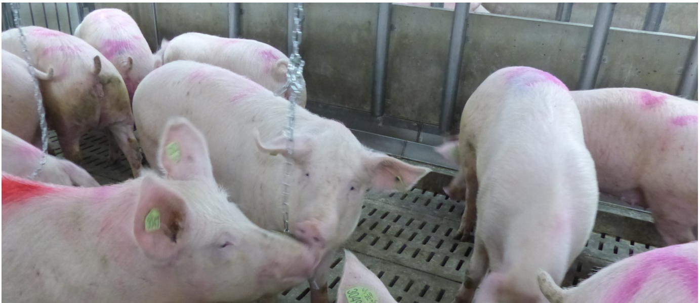
Des truies jouent avec des chaînes utilisées pour l'enrichissement.

Rédaction : Geoff Geddes pour Swine Innovation Porc | Traduction : Élise Gauthier | 17 juin 2021